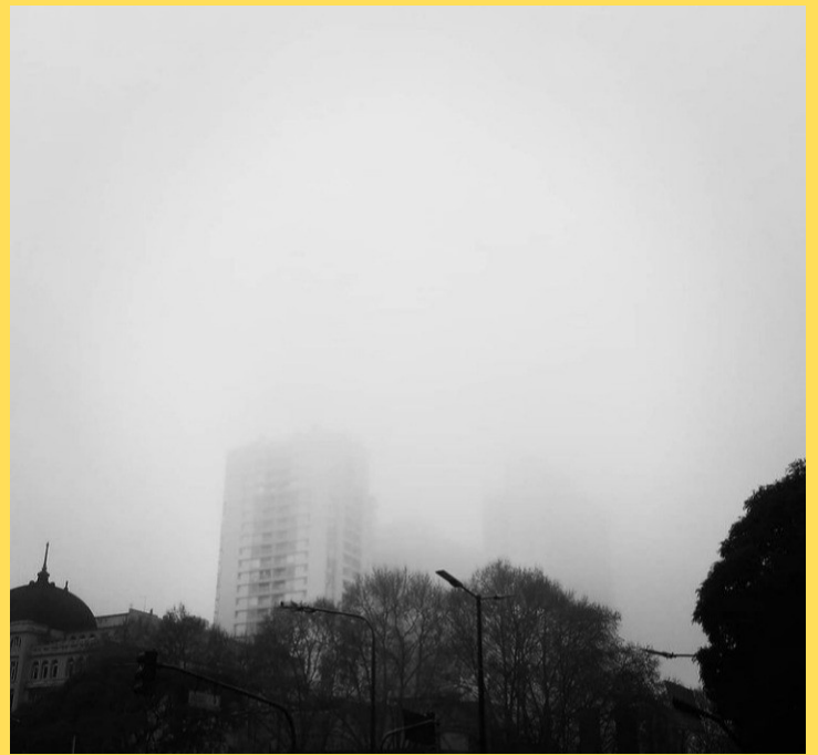
Buenos Aires la neblina te envuelve